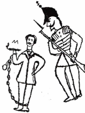
Tatuaj Un deținut spre eșafod

Bucureștii au fost și încă mai este „o carte de vise” pentru aceea care nu-l cunoaște și nu-i de mirare că aici „orice femeiușcă visează catifea, trăsuri și palate deși nu are ce mânca acasă”, încă din 1842, dacă ar fi să-l cităm pe puritanul Wilkinson. Eleganța