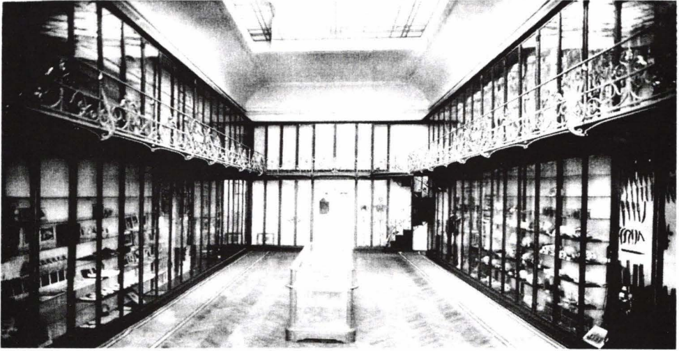
Institutul de Medicina legală Mina minovici

hazard, natura experimenta cele mai hidoase forme de supraviețuire. Copii făceau veritabile slalomuri printre epidemiile periodice de variolă, malarie, scarlatină, pelagră, asta dacă nu se nășteau tuberculoși, sifilitici sau rahitici.