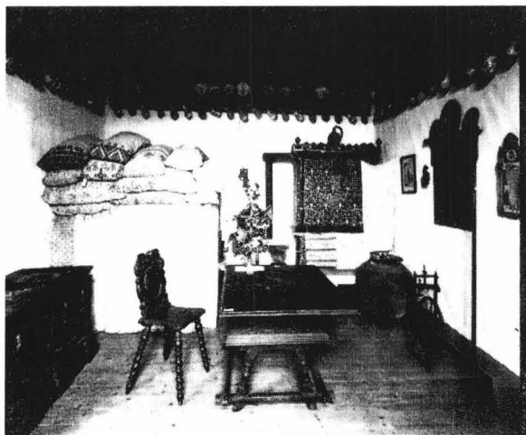
Interior de Cisnădioara, Sibiu, Muzeul S.K.V., 1895

Atunci s-a hotărât ca muzeul să poarte numele Museum des Siebenbürgisches Karpatenvereins (prescurtat MSKV), rolul acestuia fiind acela de a salva și valorifica patrimoniul etno-cultural 4 . Dintre membrii fondatori a fost ales ca director, etnologul și colecționarul Emil Sigerus 5 .