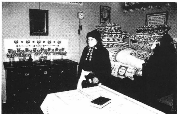
Expoziția temporară Civilizație transilvănească. Arta populară a minorităților germanice. Ceramică și broderii, august 1996

realizarea de materiale publicitare care să rezece cultura tradițională săsească în locul care i se cuvine.