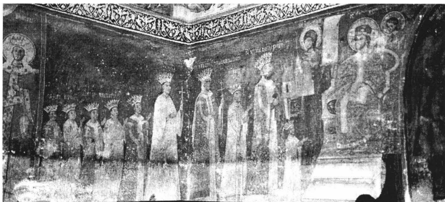
foto 1. Frescă din naos