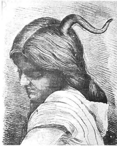
Fig. 1 și 2. Copii cu diformități de la sfârșitul secolului al XIX-lea

cu două trunchiuri, dar cu un cap, să fie înscris în registru ca un singur individ; un monstru cu două capete și un singur trunchiu, să fie privit ca doi indivizi”. 3