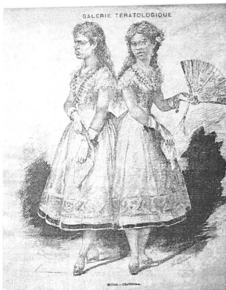
Fig.3. Dubletă- descend de la sfârșitul secolului al XIX-lea

covârșitoare și iubirea de oameni biruiește într-o asemenea întâmplare, atât după legea bisericască, cât și după cea firească”. 5