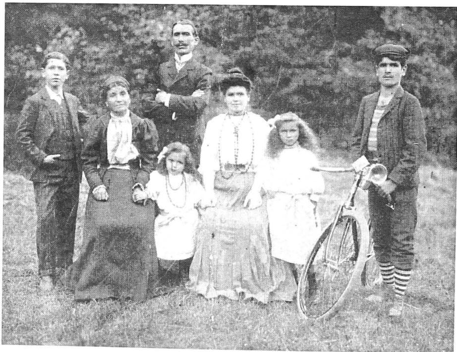
Fig. 1. O călătorie patriarhală - 1900

Vilegiatura ca modă a cotidianului modern se extinde treptat către partea superioară a middle class încă de la finalul secolului al XIX-lea. Mulți români ai vechiului regat se bucurau de micro-stațiunile locale aflate într-o fază incipientă de organizare sau modernizare