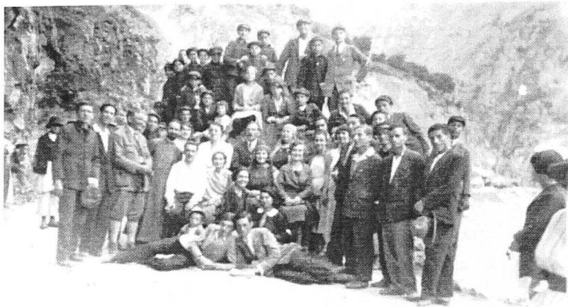
Fig. 3. Excursie la Runcu - 1932

Drumurile către orașele și satele Ardealului sunt luate cu asalt de bucu-reștenii dornici de aventură și cunoaștere. Preocuparea pentru vilegiatură coboară și spre clasele mijlocii inferioare iar vârsta celor care se bucurau de libertatea de a călători începe să scadă. Ceea ce nu era îngăduit la 1900, de pildă adolescenții nu plecau în grupuri la munte, ci doar în familie și în anturajul adult al acesteia, după 1920, tineri liceeni sau studenți își organizează împreună timpul vacanței și traseele de călătorie.