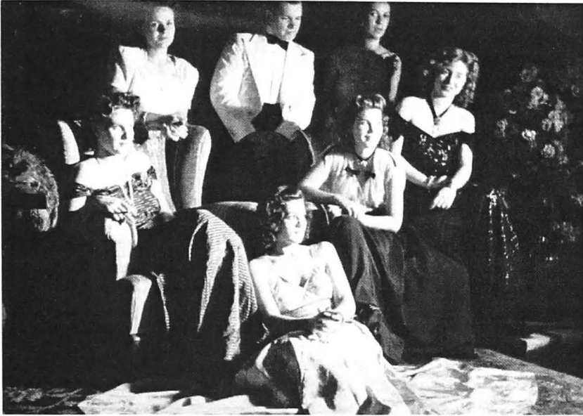
Fig. 4. O soarelă privată din anul 1942

cu adevărat elegant, prin felul în care îți faci simțită prezența pe stradă. Cât mai puțin evidentă prin gesturi, urlete, priviri etc. Acesta era un prim pas al codului aristocrat de care amintește Ion Ghica, pas pe care l-a învățat din copilărie. Drumul spre înalta societate până la 1945 era presărat cu adevărate inițieri privind comportamentul, vestimentația, măsura