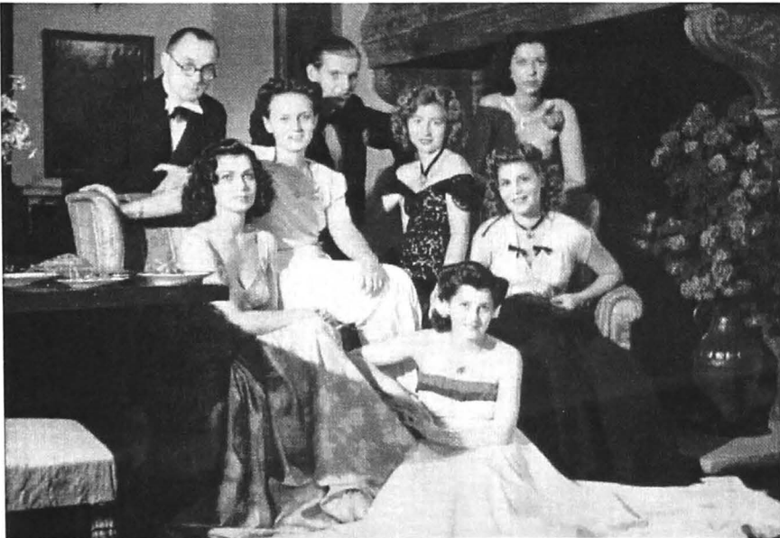
Fig. 5. Soarelă particulară din 1940

Înalta societate investea în propria-i spiritualizare, ajutându-i adesea și pe alții fără mijloace, cu ajutorul unor accesorii precum contul bancar, vila suplimentară