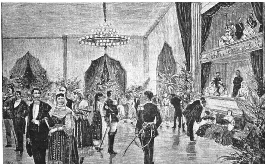
Fig. 1. Bal la Teatrul Național din București, 1884

Din nefericire acești oameni, de etnie și confesiuni foarte variate, care s-a topit într-un mixtum compositum între 1870 și 1930, exportatori de modele comportamentale către marginea societății, au fost evacuați din istorie iar fotografiile pe care le admirați alături de aceste rânduri, nu mai au corespondență în realitatea