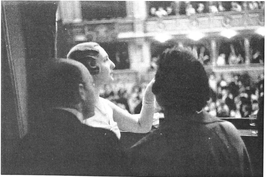
Fig. 3. Privind de la balconul Operei, 1937

Rămâne totuși întrebarea unde ne este înalta societate? Care sunt resturile prin care respiră, gesturile vizibile și codurile ascunse vederii celor mulți? Ești