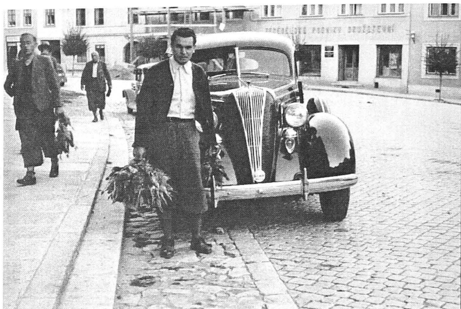
Fig. 6. Întors de la vânătoare - 1930

de la Șosea transformată ocazional în cenaclu literar, club pentru artiști, societate filantropică etc. Intrarea în lumea bună a adolescentului se realiza tot cu discreție la primul bal, către vârsta de 15-16 ani, când părinții îl prezentau rudelor mai îndepărtate, prietenilor de diferite ranguri, apropiaților din lumea afacerilor. La rândul lor, adulții intrau pe scena publică, prin baluri de binefacere, pentru strângerea fondurilor necesare stingerii unor suferințe cotidiene, în fața cărora societatea reacționa cu greutate.