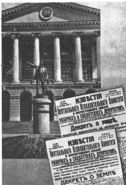
Palatul Smolnii din Leningrad

Totul s-a schimbat în acest cartier, numai apartamentul cu nr. 20 se păstrează cu cea mai mare grijă. De aici, din ultima sa casă conspirativă, Lenin a îndrumat pregătirea insurecției armate din octombrie. Din această casă, la 24 octombrie, seara tîrziu, el a plecat spre Smolnii — statul major al Marelui Octombrie. În drum spre Smolnii ne oprim emoționați pe str. Hersonskaia nr. 5, ap. 9, la o altă casă muzeu unde a stat Lenin. Aici, în noaptea de 7/8 noiembrie 1917, Vladimir Ilici a scris istoricul decret asupra pămîntului, care a fost adoptat de Congresul II al Sovietelor din Rusia.