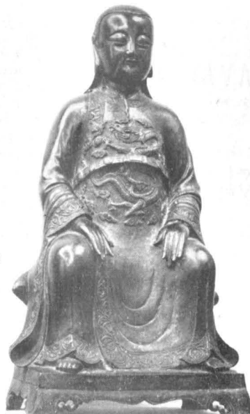
Confucius, sculptură (bronz) artă extrem-orientală.