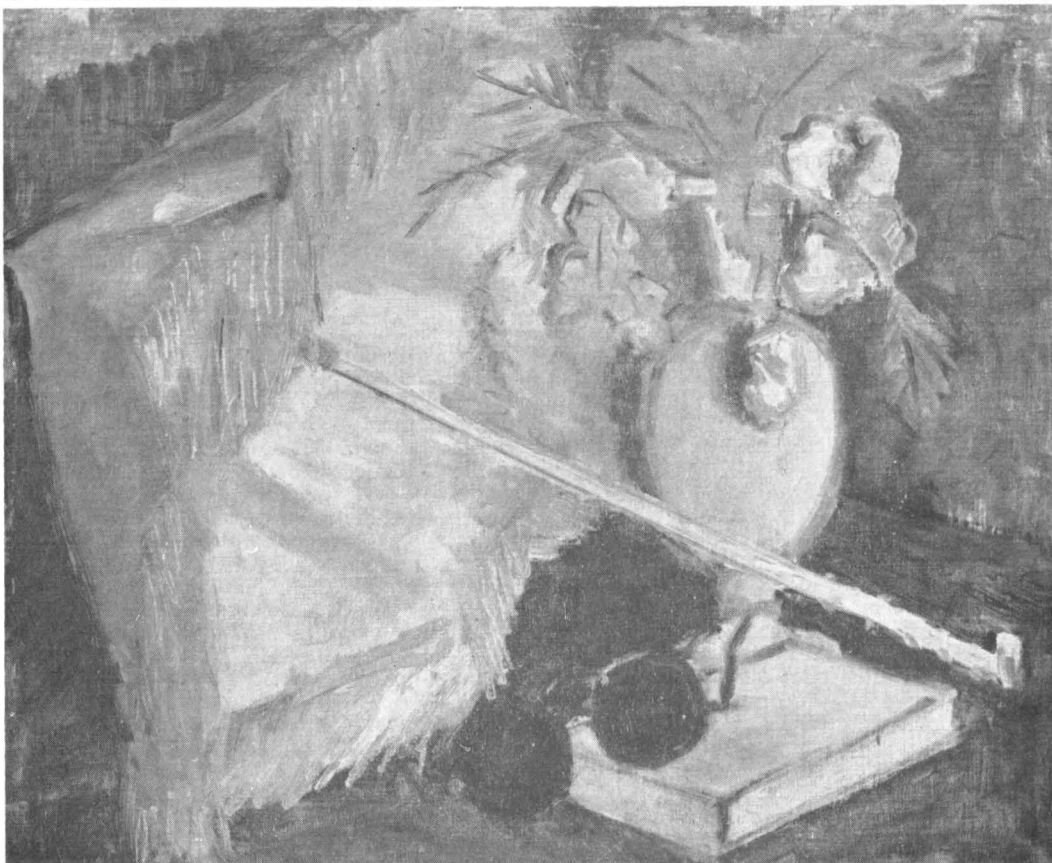
Theodor Pallady, Natură statică cu umbrelă.