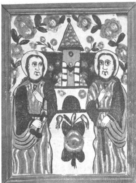
Icoană din Maramureș, sec. XIX.