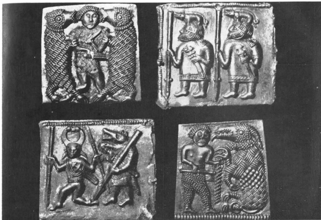
Matrițe de bronz pentru imprimarea foliilor de metal, Torslunda, Țlanda, sec. VII.

care culminează în perioada vendeliană (600—800 e.n., denumită după mica localitate Vendel).