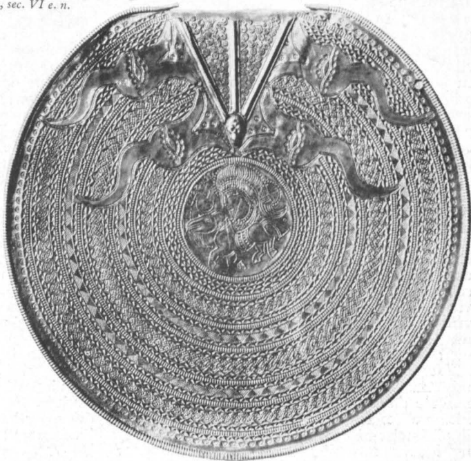
Aplică de curea de bronz aurit, Vendel, Uppland, sec. VII e. n.