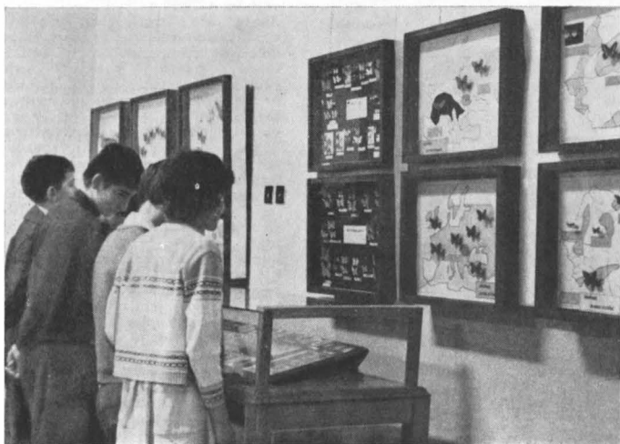
Vizitatori în expoziție

Valoarea științifică a materialului expus, precum și originalitatea și acuratețea modului de prezentare explică succesul deosebit al acestei expoziții. Numărul impresionant de persoane,