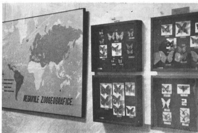
Aspect parțial din tema „Răspîndirea geografică a lepidopterelor”

exemplare impecabile în captivitate, precum și metoda de urmărire a stadiilor de dezvoltare.