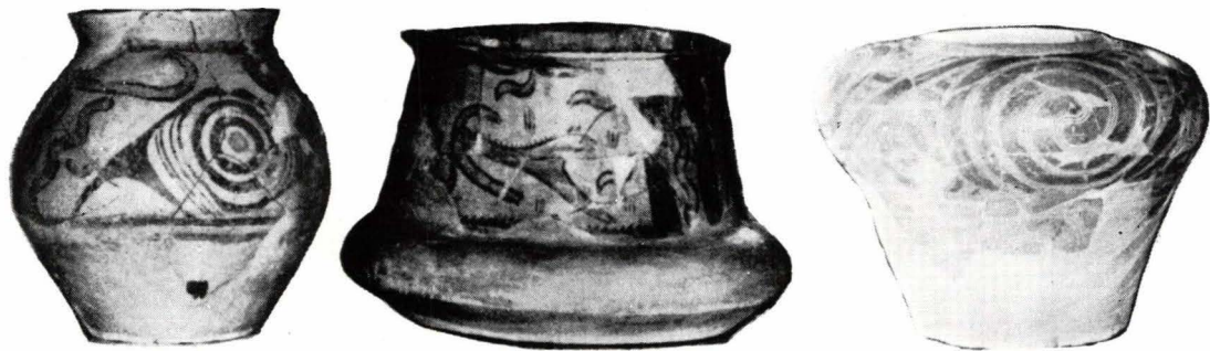
EXPONATE DIN MUZEU

O atenție deosebită i s-a acordat culturii Cucuteni, care ocupă două săli. În prima, este ilustrată faza A a acestei culturi, cu minunata ceramică pictată în trei culori, în toate varietatea formelor și frumusețea decorului. Două piese unice în aria de răspindire a culturii Cucuteni-Tripolie ilustrează cultul fertilității și fecundității. În registrul superior diapozitivele înfățișează planul Hăbășeștiului, prima așezare cucuteniană săpată în întregime, și panorama cetății din așezarea eponimă.