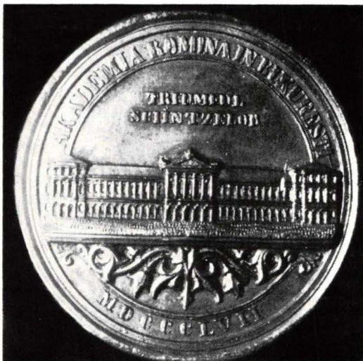
MEDALIA COMEMORATIVĂ EMISĂ CU PRILEJUL PUNERII PIETREI FUNDAMENTALE A UNIVERSITĂȚII DIN BUCUREȘTI, 10 OCT. 1857.

În afară de aceste detalii, trebuie să remarcăm și unele piese de mare importanță și valoare din patrimoniul muzeului. Astfel, reținem : un portret în ulei ce-l reprezintă pe Ion Eliade Rădulescu, foarte tânăr ; portretul lui Vasile Boerescu de Oeconomu ; busturile profesorilor G. Costa-Foru și V. Boerescu de C. Storck ; primele cursuri manuscrise (1851—1852) de drept ale lui G. Costa-Foru ; diploma sa de președinte de onoare al „Institut d’Afrique” (1861) ; brevetul pentru invenția dielectrinei al prof. Dragomir Hurmuzescu ; primele diplome de la școala de medicină, semnate de dr. Carol Davilla ; fotografia de epocă a tinerilor socialiști români de la Paris, care au editat publicația marxistă „L’Ère Nouvelle” și multe altele.