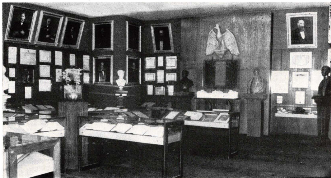
UN COLȚ DIN MUZEUL UNIVERSITĂȚII DIN BUCUREȘTI.

Colecțiile de mare valoare, originalitatea sistemului de organizare a expoziției, fac din Muzeul Universității bucureștene un lăcaș de instruire și educație patriotică, iar din punct de vedere muzeistic, un foarte reușit experiment.