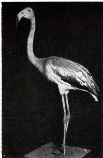
FIG. 1. PHOENICOPTERUS RUBER ROSEUS PALL., DE LA MUZEUL BANATULUI, CAPTURAT LA GRABĂȚ (BANAT), LA 22 OCT. 1943