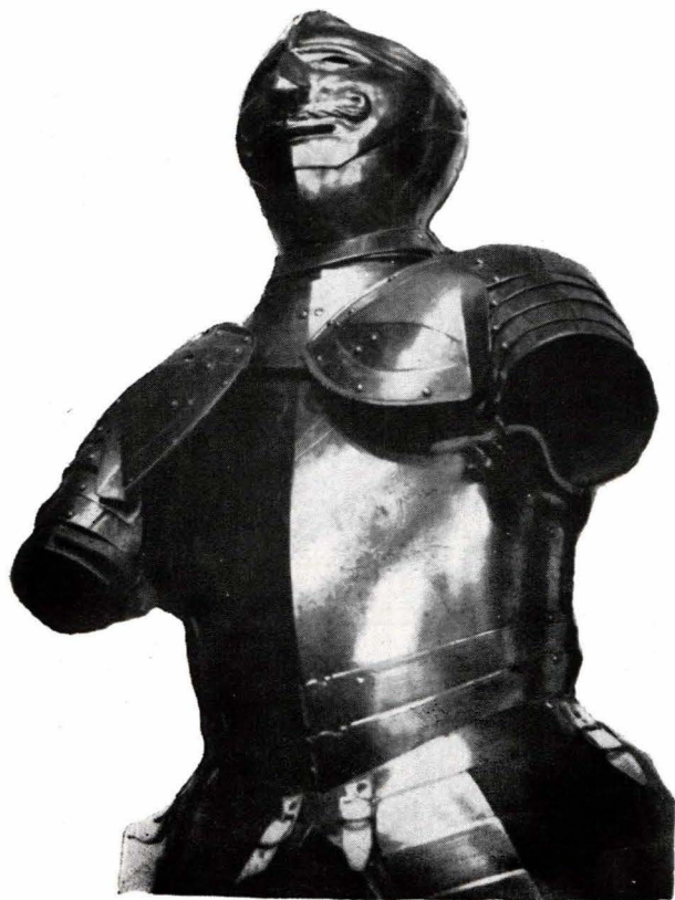
FIG. 1. CUIRASĂ ȘI CASCĂ VENEȚIANĂ DIN A DOUA JUMĂTATE A VEACULUI AL XVI-LEA.