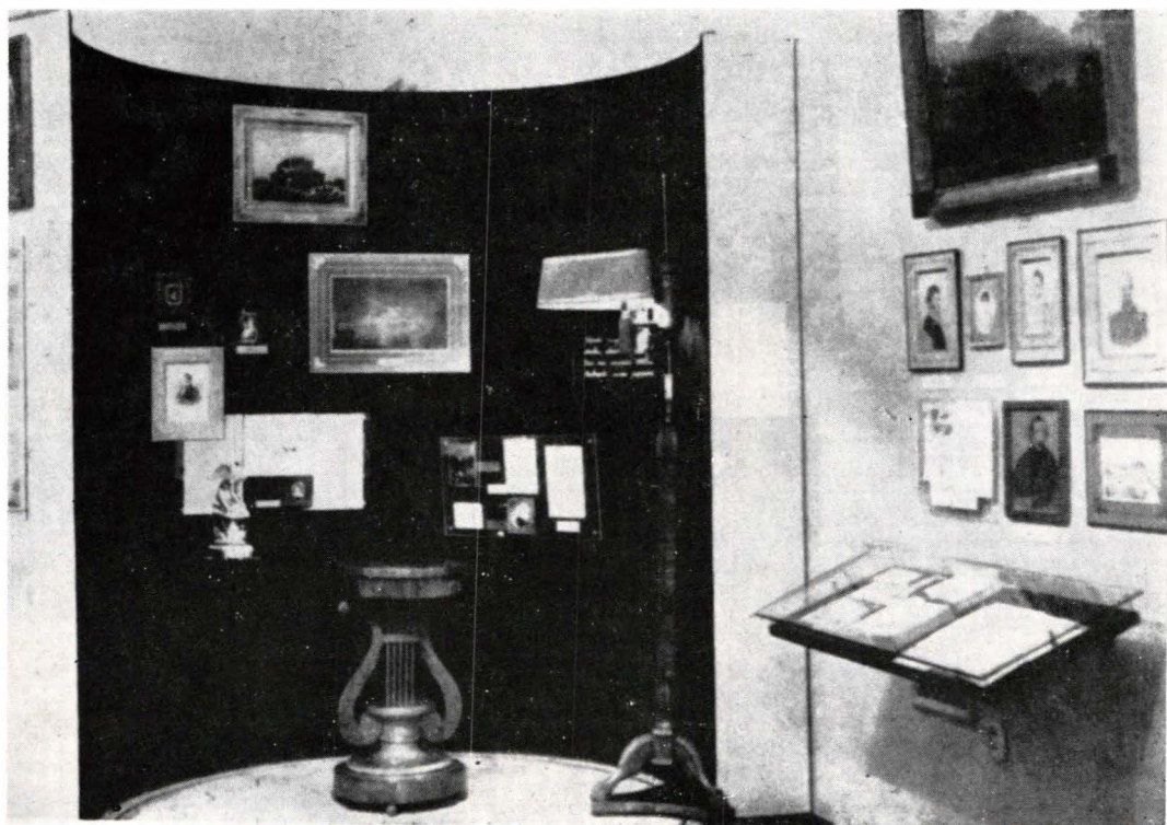
O SALĂ A MUZEULUI