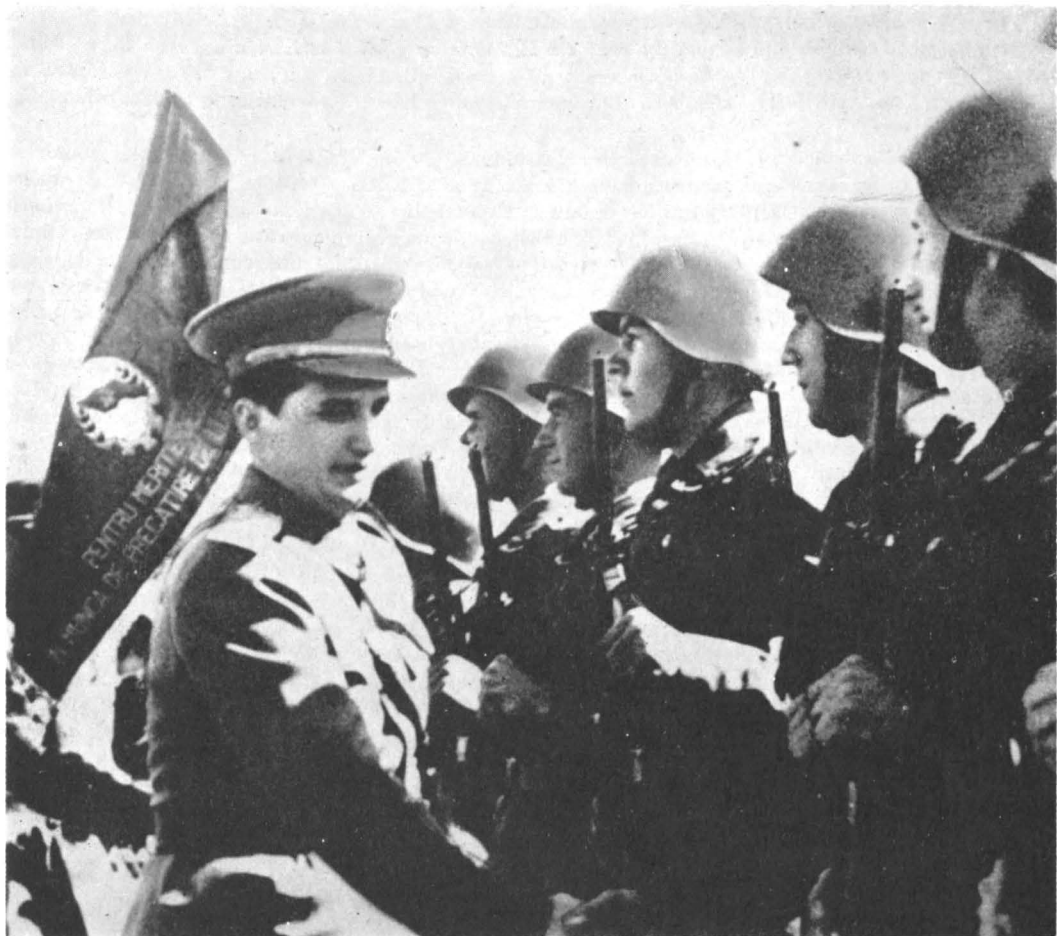
Tovarășul Nicolae Ceaușescu felicitând o subunitate fruntașă în pregătirea de luptă și politică (1952).

În grupajul de manifeste originale de pe acest panou se detașează vibrantul apel de solidarizare: Frate, tovarășe!