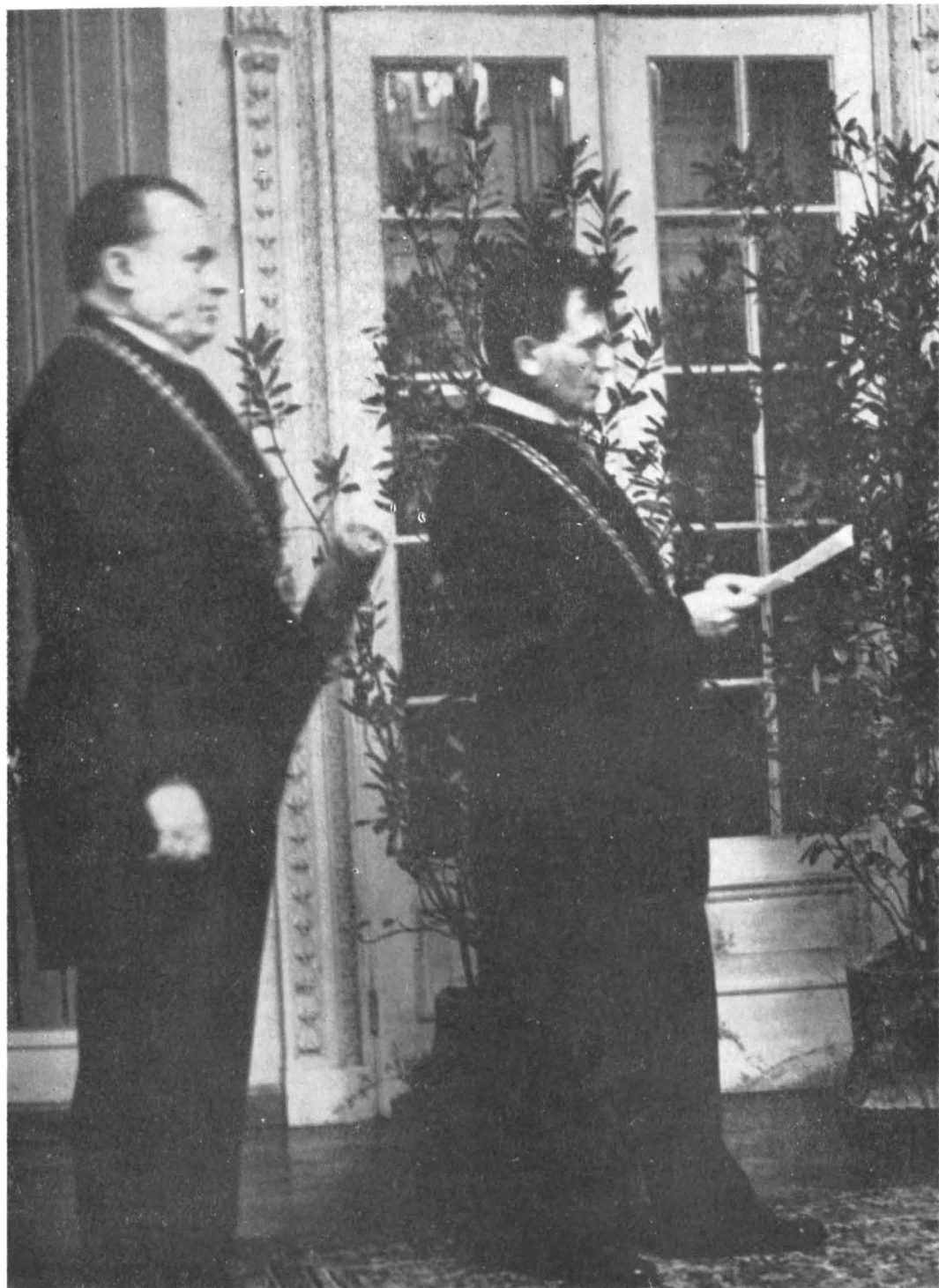
La Legația Cehoslovaciei din București, cu reprezentanții Universității