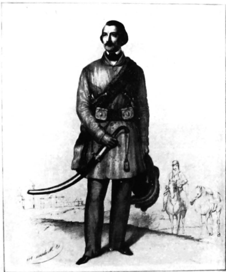
Piatra litografică realizată de P. Mateescu în 1848, reprezentându-l pe generalul G. Magheru