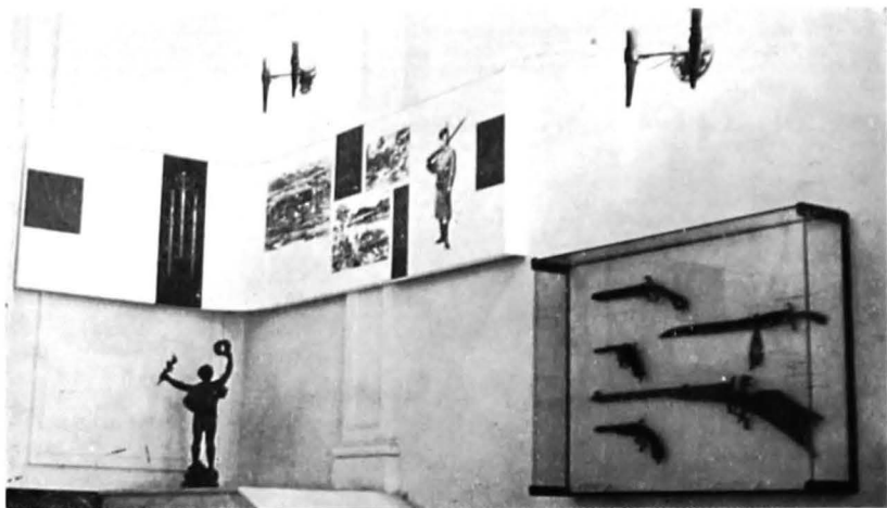
Tipuri de arme medievale care au servit la pregătirea militară și la nașterea unor noi jocuri și întreceri sportive

sa. În raporturile și acțiunile sale nu se poate spune că el crează și oferă valori noi și ar fi prematur să-i pretindem acest lucru.