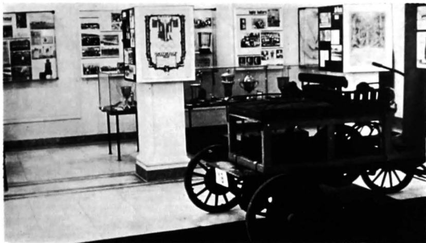
Exponate ilustrând epoca modernă a sporturilor

Formula de concepere, de prezentare în ultimă instanță a evoluției sportului românesc prin intermediul muzeului, nu este unică.