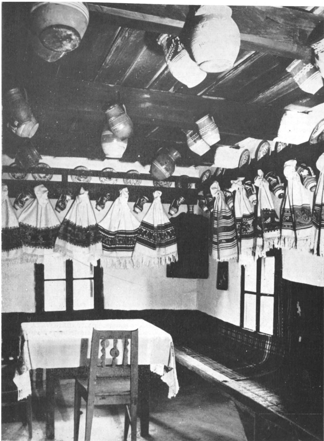
Interior din gospodăria din com. Telciu, jud. Bistrița - Năsăud