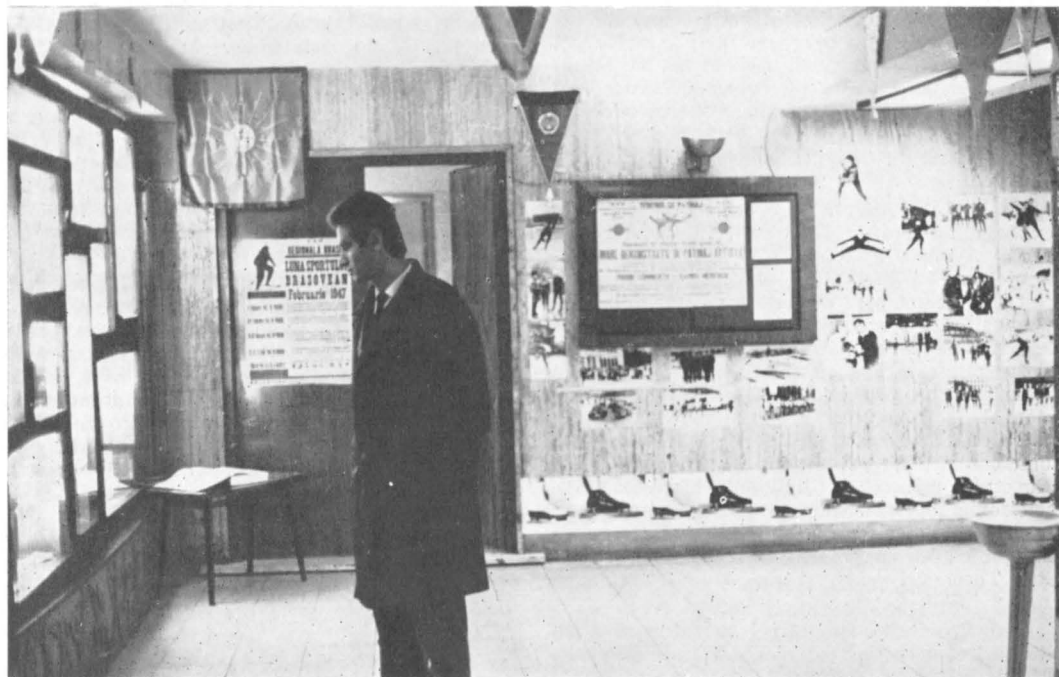
Aspect din expoziție

Medaliile emise în anul înființării, avînd pe avers emblema societății, constituie documentul