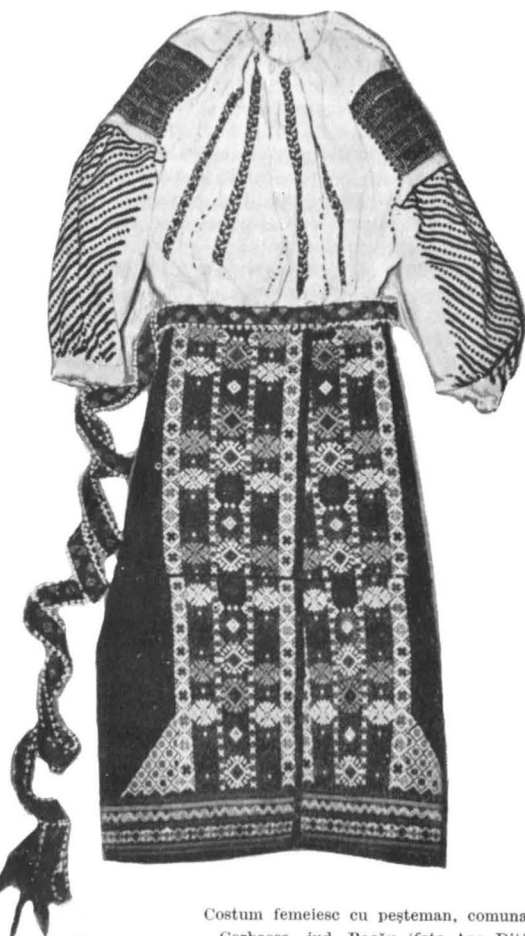
Costum femeiesc cu peșteman, comuna Corbasca, jud. Bacău

Sub aspect decorativ se remarcă ornamentele realizate din alesături, impresionînd discreția moti-