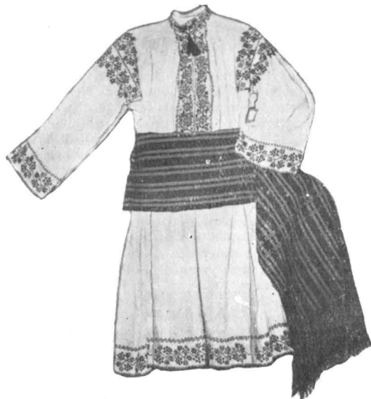
Costum bărbătesc din zona Colinelor Tutova Costum bărbătesc din comuna Vama, jud. Suceava ►