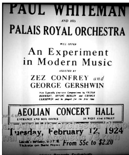
Afișul original

La acest concert au participat, ca spectatori, Rahmaninov și Stravinski, acest fapt subliniind importanța evenimentului.