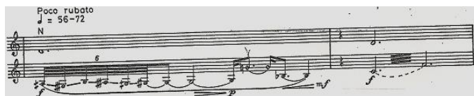
Ex. muz. nr. 1, măs. 1-2

Paleta dinamică și timbrală este diversă, dar în comparație cu secțiunile următoare se simte o limitare în folosirea sonorităților extreme (nu se trece de forte , respectiv pianissimo ).