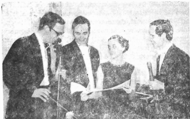
Formația de instrumente vechi a Facultății de muzică din Braşov