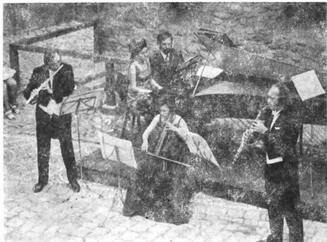
„Collegium Musicum Academicum“ din Cluj