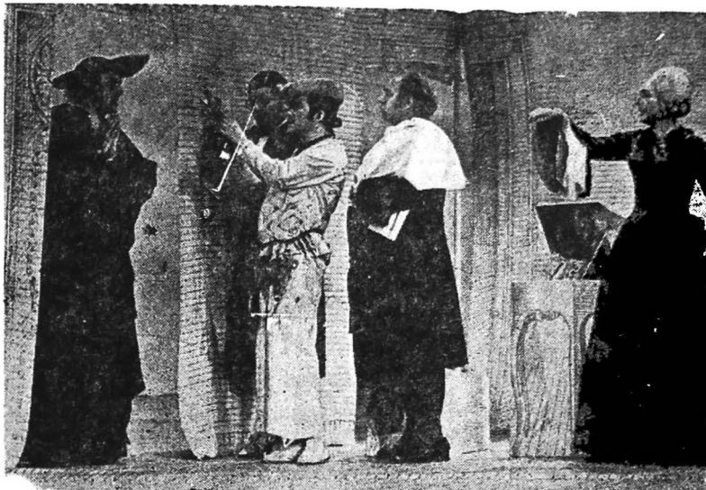
„Bărbierul din Sevilla“ de Rossini în interpretarea soliștilor Operei de Stat din Berlin

„Săptămînile festive vieneze“, care și-au dobîndit pe parcursul celor douăzeci și două de ediții anterioare un prestigiu întemeiat în rîndul festivalurilor de pe continent, a adăugat un spor de calitate faimei sale printr-o și mai bună alegere, de astă dată, a artiștilor-oaspeți și a ansamblurilor străine invitate. A fost interesantă, de pildă, confruntarea unor colective artistice de ținută și vechi tradiții în interpretarea repertoriului rossinian, care a dominat o mare parte a repertoriului liric în ultima ediție. Scala din Milano a prezentat Cenușăreasa , sub bagheta lui Claudio Abbado, care i-a păstrat muzicii