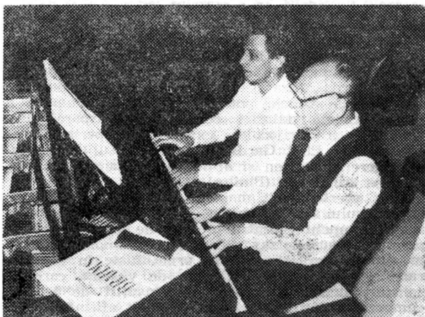
Nikita Magaloff și Michel Dalberto

Am avut, de-a lungul dimineților și serilor egal de luminate, la Meslay, de capacitatea de comunicare a muzicii lui Brahms, și revelația meritelor noilor generații de interpreți francezi. Astfel, Michel Dalberto, înfățișat lumii muzicale de victoriile obținute la concursuri de notorietate („Clara Haskil“ — Vevey 1975 și Leeds, 1978) a colaborat, la două pianе și patru miini, cu marele Nikita Magaloff, care la 75 de ani rămîne același pianist de farmec și concepție,