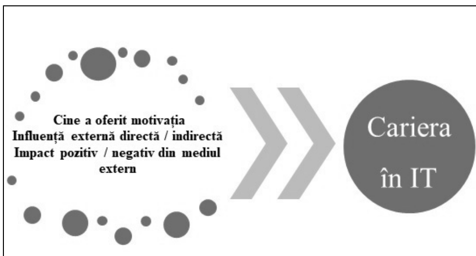
Figura 1. Argumentele opțiunii de carieră și tipuri de traiectorii în mediul IT.