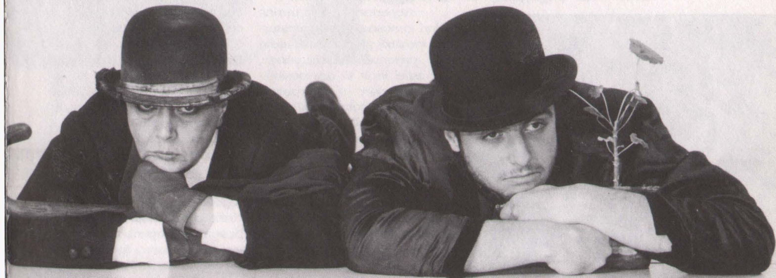
Așteptându-l pe Godot de S. Beckett (regia: Gelu Badea)

ții. În primul rând, s-a căutat ca oferta rolurilor să fie sensibil egală prin întindere și complexitate, ca fiecare să treacă de la monolog la relație cu un partener sau la scene de grup. Numărul personajelor a fost redus la șapte, fapt ce a condus spre formula unei distribuții duble, în care evoluează toți cei zece studenți. În al doilea rând, explorarea textului cehovian a fost îndreptată înspre rezolvarea unor situații, existente ori numai posibile, într-o multitudine de chei. Momente veritabile de teatru antic și ritualic, commedia dell'arte și dans, romantism și realism se succedă într-o demonstrație vie, credibilă și lipsită de ostentație. Tinerii actori formează o echipă unită printr-o serie de calități comune – dăruire, mobilitate, rostire nuanțată –, în interiorul căreia ierarhizările val-