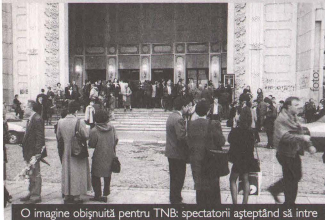
O imagine obișnuită pentru TNB: spectatorii așteptând să intre

D upă 1989 a existat, cum era și firesc, un timp al căutărilor, al reazășăriiilor. Teatrul de imagine, teatrul-dans au pătruns cu încetul în "curtea" teatrului de cuvânt, fără a-i face celui din urmă vreun rău ireparabil. Paradoxal, deși la noi, la acea oră, nu existau decât teatre de repertoriu, alegerea pieselor începuse să se facă la întâmplare, în numele unei "benefice" nevoi de descentralizare (care risca să semene tot mai mult cu o sămânță de haos). Regizorii ignorau dramaturgia națională contemporană, dar nu ezitau să pună în scenă destule texte puerile, numai pentru că erau americane, franțuzești sau englezești. Dar faptul cel mai trist a fost că publicul a părăsit pentru o vreme sălile de teatru în favoarea altor modalități de divertisment: cinematografe, discoteci, jocuri electronice, televiziune, politica străzii... În vremea din urmă – chiar dacă semnele vreunui început de reformă refuză să se arate – lucrurile par a se întoarce în matca normalității: dramaturgii români coexistă (frățește) pe afișe cu cei străini, se lucrează mult, e drept că tot cam fără vreo linie directoare, se joacă aproape în fiecare seară a săptămânii (în București cel puțin) și, lucru îmbucurător, spectatorii s-au întors la teatru (mai ales cei tineri!).