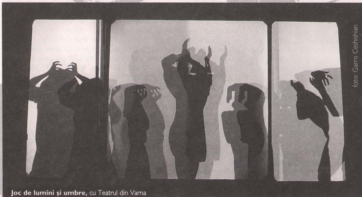
Joc de lumini și umbre, cu Teatrul din Vama

Am enumerat aceste idei dezbătute la finalul săptămânii internaționale, pentru că mai ales în umbra lor merită să cântărim cele petrecute. Generalizând, nu vom lua în calcul decât ce am văzut în răstimpul amintit, pornind de la premisa că bucățile selecționate sunt reprezentative atât pentru mișcarea din țară cât și pentru cea din afara ei. Teatrul de păpuși din România pare a se adresa aproape exclusiv copiilor. Este același "aproape" pe care am promis a-l justifica. În festival am văzut o singură și strălucită excepție: Adu-narea păsărilor , după Farid Udin Attar, în regia lui Cristian Pepino. Un cioc mare prins la capătul unei tije acoperite cu pânză albă, care ascunde actorul, este pasărea, manevrată la vedere de către cel care, uneori,