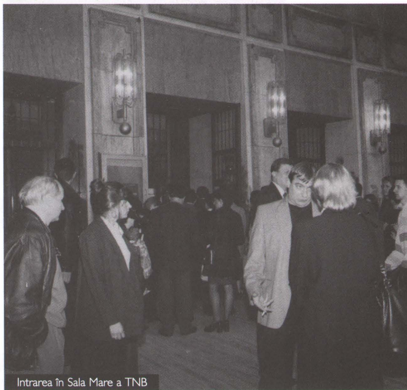
Intrarea în Sala Mare a TNB

dine sau probează un costum. Așadar, conform obiceiului, în jurul lui 11.30 trecute, se pomește activitatea la Costumele , în regia și scenariul lui Dan Puric. În paralel, la cealaltă sală se pregătește D'ale carnavalului ; aici, însă, nu am avut acces. Regizorul, Horațiu Mălăele, a dorit să păstreze intimitatea repetițiilor "individuale" (= lucrul cu fiecare actor în parte), domnia sa crezând, probabil, că ele ar fi fost de mai puțin interes pentru spectatorul pasager decât un "șnur" (= reprezentarea de la cap la coadă a fragmentelor repetate în prealabil pe bucăți). Costumele va fi, din câte se prevede, un spectacol construit din binecunoscutul