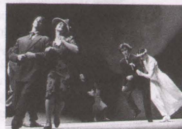
"VOYAGE ORGANISÉ" COREGRAFIA DOMINIQUE BAGOUET

Există două lucruri care, mai presus de toate, îmi evocă universul lui Bagouet: felul în care m-a învățat cum poate un dansator să fie, pe scenă, enigmatic și transparent în același timp și cele câteva cuvinte pe care mi le-a scris pe colțul unui afiș: "Pentru Răzvan, în amintirea dansului său, a gentilei sale. Cu pretenție sinceră, Dominique Bagouet".