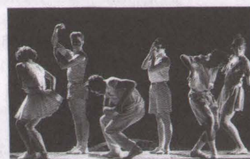
"NECESITO" COREGRAFIA DOMINIQUE BAGOUET