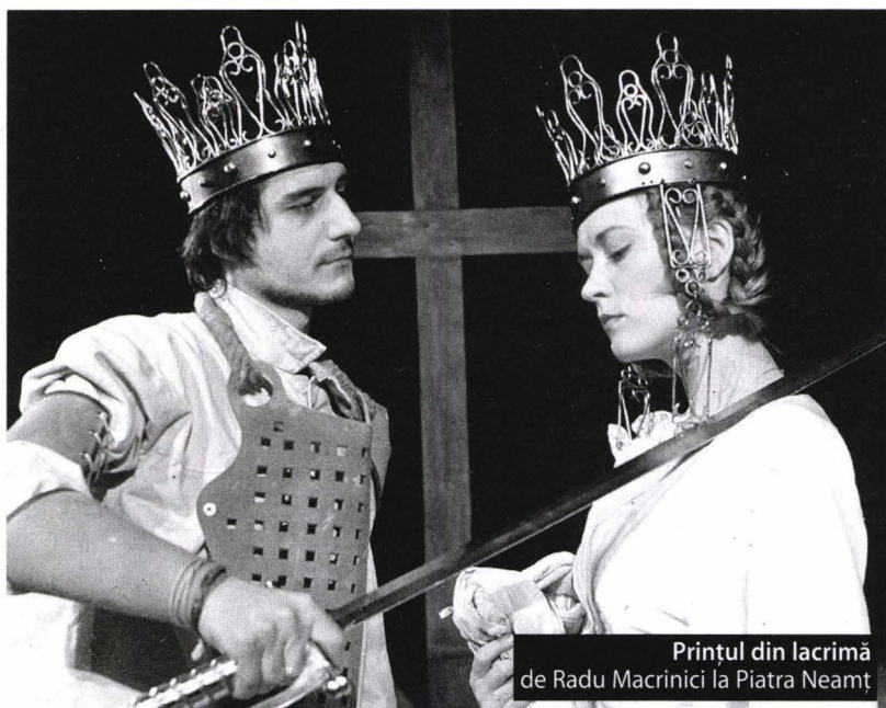
Prințul din lacrimă de Radu Macrinici la Piatra Neamț

5. Cui nu i s-a întâmplat, "măcar o dată, doar o dată-n viața lui"? Amărăciunea e mare, însă, așa că exemple nu pot da fiindcă m-am străduit și mă străduiesc din răsuputeri să le uit.