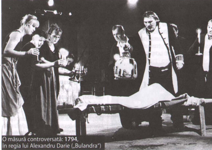
O măsură controversată: 1794, în regia lui Alexandru Darie („Bulandra“)

10. Există un raport de la cauză la efect între lipsa de idei, prostul gust și inexpresivitate, pe de o parte, și starea de iritare pe care o poate induce un spectacol, o carte, film sau emisiune de televiziune.