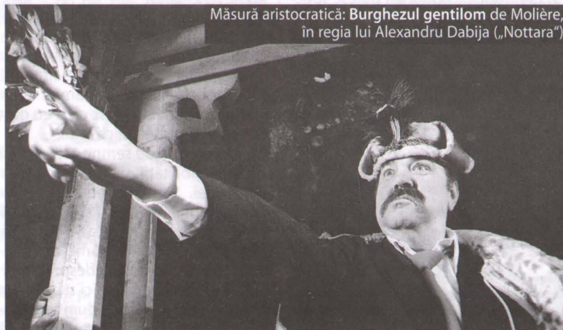
Măsură aristocratică: Burghezul gentilom de Molière, în regia lui Alexandru Dabija („Nottara”)

11. Dacă este încărcătură, înseamnă că trece de limită și devine superfluă, fără măsură. Există o limită, cea a bunului-simț, înainte de limita dedusă din regula estetică, ce nu-i permite unui pictor, de pildă, să combine culorile decât într-un anumit fel. 12. Fiecare artist are momentele lui de grație și nu poate fi genial în orice moment. Așa încât nu cred că se poate face o listă de creatori, ci de