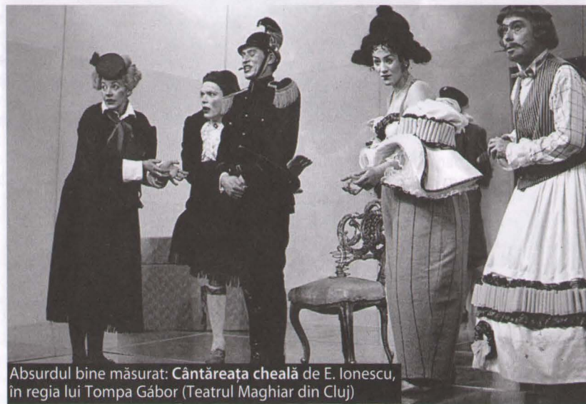
Absurdul bine măsurat: Cântăreata cheală de E. Ionescu, în regia lui Tompa Gábor (Teatrul Maghiar din Cluj)

3. Nu cred că sunt preocupați de chestiunea în discuție mai puțin decât creatorii de altă naționalitate