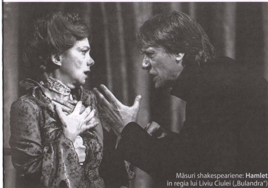
Măsuri shakespeareiene: Hamlet în regia lui Liviu Ciulei („Bulandra”)

6. Nici un fel de exces nu are justificare. Cei care caută argumente pen-