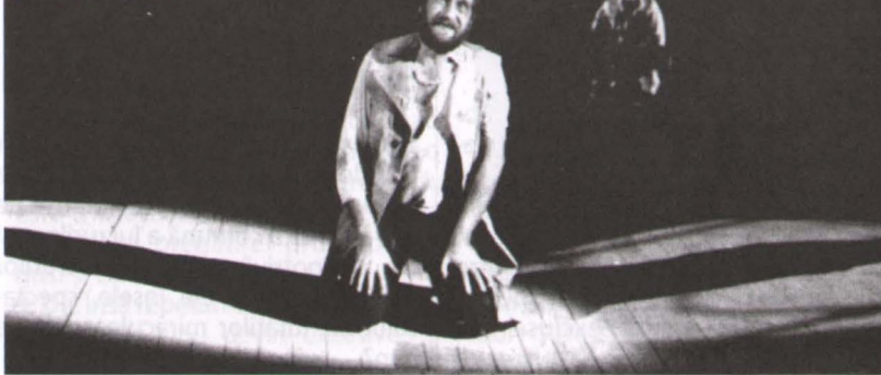
Măsură internațională: Andrei Șerban – Cine are nevoie de teatru? de T. Wertenbaker (TNB)

dide și scurtimi tulburătoare în veci. Tocmai aceste exagerațiuni exemplare dau măsura operei de artă, precum o poate da conformismul geometric cel mai riguros.