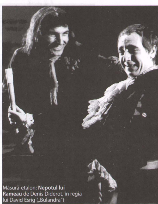
Măsură-etalon: Nepotul lui Rameau de Denis Diderot, în regia lui David Esrig („Bulandra”)

1. Împărtășesc starea de inconfort care a generat caracterul concret al acestor întrebări: în ultimul timp, pentru spectatorul consecvent de teatru, stăruie impresia că, dacă actorii ar vorbi ceva mai încet, dacă