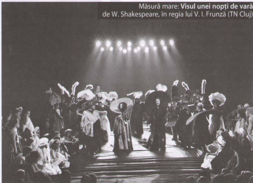
Măsură mare: Visul unei nopți de vară de W. Shakespeare, în regia lui V. I. Frunză (TN Cluj)

tru a scuza ceea ce nu poate fi scuzat o fac pentru a fi interesați, originali, pentru a părea „open minded”. Dar o fac pe riscul lor. Mă tem însă că astfel discreditează modul în care e perceput discursul critic de către creatorii de spectacole.