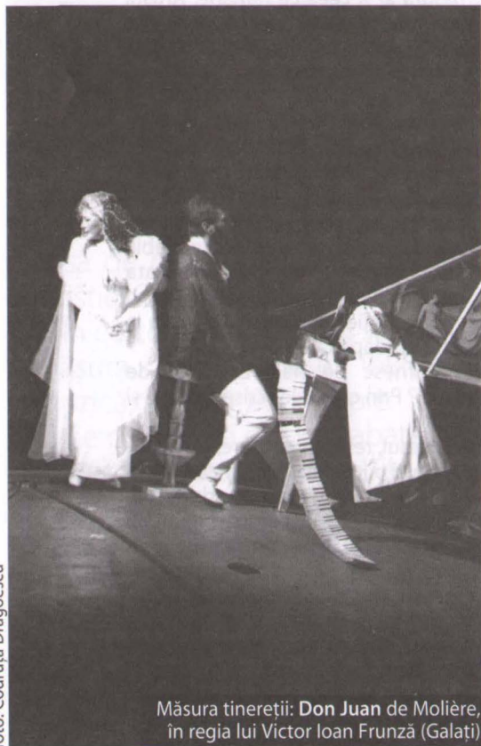
Măsura tinereții: Don Juan de Molière, în regia lui Victor Ioan Frunză (Galați)

4. La lectură, un text poate să i se pară criticului lung și plictisitor, dar un regizor inspirat poate să croiască din materia supraabundentă o reprezentare cvasi-perfectă.