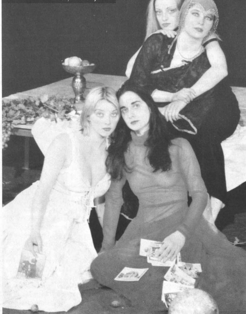
Patru absolvente ale departamentului de Teatru al Universității din Cluj

Anchetă realizată de Mirona Hărăbor și Marinela Țepuș