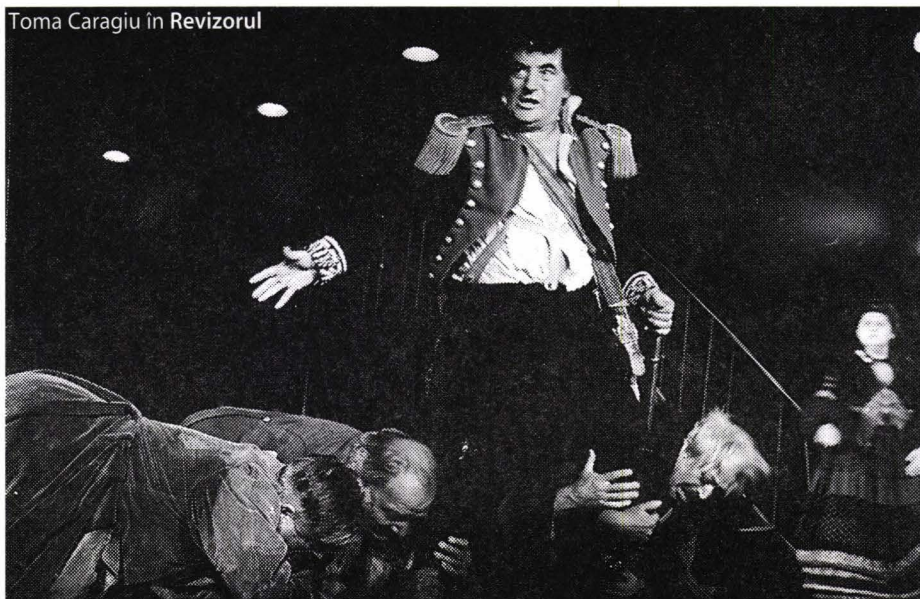
Toma Caragiu în Revizorul

El nu are un sens liberator: vocația sa, opusă efervescentei, dezvoltă teribila spaimă a înăbușirii. Scandalul apare ca o consecință a unei puteri tari, capabilă să interzică exercițiul oricărui act simbolic susceptibil să o pună în discuție; însă, la scara societății, ce mai rămâne din teatru în afara contestației? Dar el poate, totuși, să lase să se vadă o deschidere, să profite de o breșă, de o crăpătură din zid. Cenzura declanșează și își asumă acest scandal pentru a interzice orice speranță. Ea se teme de contaminare și decide asasinarea germenilor amenințatori. Și, ca pe vremea epidemiilor de ciumă, gestul este cel de zăvărare a porților pentru a se asigura o izolare etanșă. În pofida acestor măsuri, scandalul de implozie operează în interiorul teatrului: comunitatea acestuia este tulburată. Artiștii care l-au provocat ies întotdeauna cu o aură sporită, efect al prețului plătit pentru mutilarea, trecătoare sau definitivă, a artei lor. Scandalul de implozie lasă întotdeauna în urma lui eroi. Dar, victorie a cenzurii, compa-