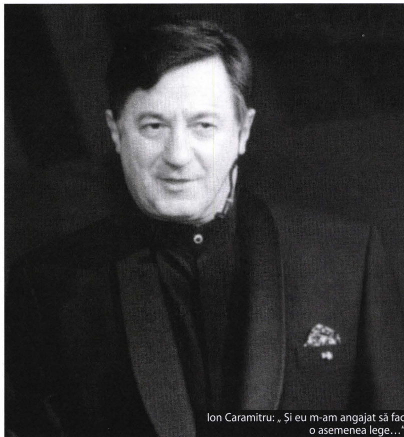
Ion Caramitru: „Și eu m-am angajat să fac o asemenea lege...”