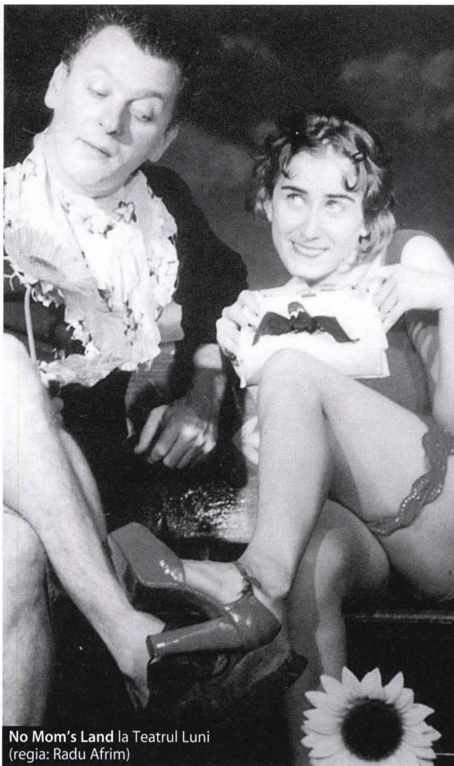
No Mom's Land la Teatrul Luni (regia: Radu Afrim)