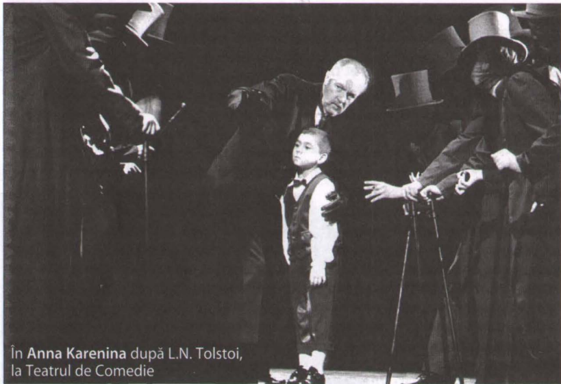
În Anna Karenina după L.N. Tolstoi, la Teatrul de Comedie