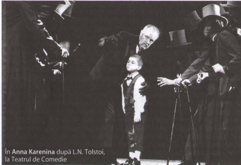
În Anna Karenina după L.N. Tolstoi, la Teatrul de Comedie

S-a mai întâmplat ceva acolo: au repetat și au jucat cot la cot actori din vreo cinci-șase teatre. Cu mentalități și modalități de lucru