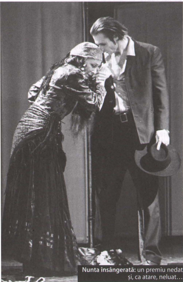
Nunta însângărată: un premiu nedat și, ca atare, neluat...

ce juriul Galei are o deschidere mai largă.