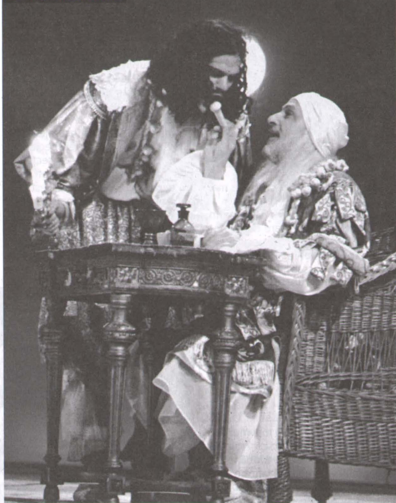
Anul trecut: Iluzia comică