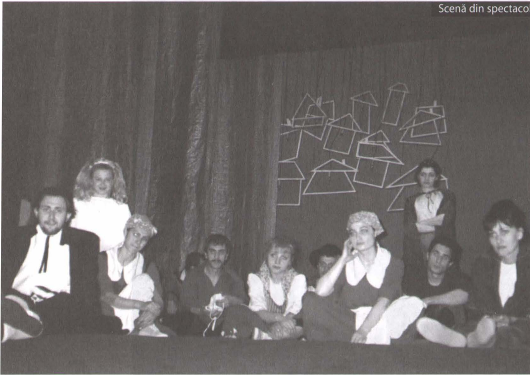
Scenă din spectacol

oraș cu proști, numită „la bază” Orașul înțelepților sau Înțelepții din Helem, este, practic, o snoavă – probabil, de inspirație folclorică – în care capetele luminate din târgul Helem (după toate aparențele, o așezare „înfrățită” cu al nostru Caracal...) se chinuie să scape orașul de prostia personificată, după părerea