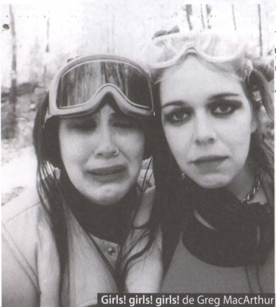
Girls! girls! girls! de Greg MacArthur

mijloace dintre cele mai diverse, de la mărturia unei femei căreia i-au fost masacrați soțul și cei doi copii, prezentarea „la rece” a faptelor într-o expunere istorică, momente folclorice, numere de cabaret politic și până la zguduitoare imagini filmate în timpul evenimentelor – este evocat genocidul în care, în Ruanda, în 1994, au fost uciși de luptătorii hutu, într-o singură lună, peste un milion de oameni a căror vină era doar aceea că aparțineau etniei tutsi).