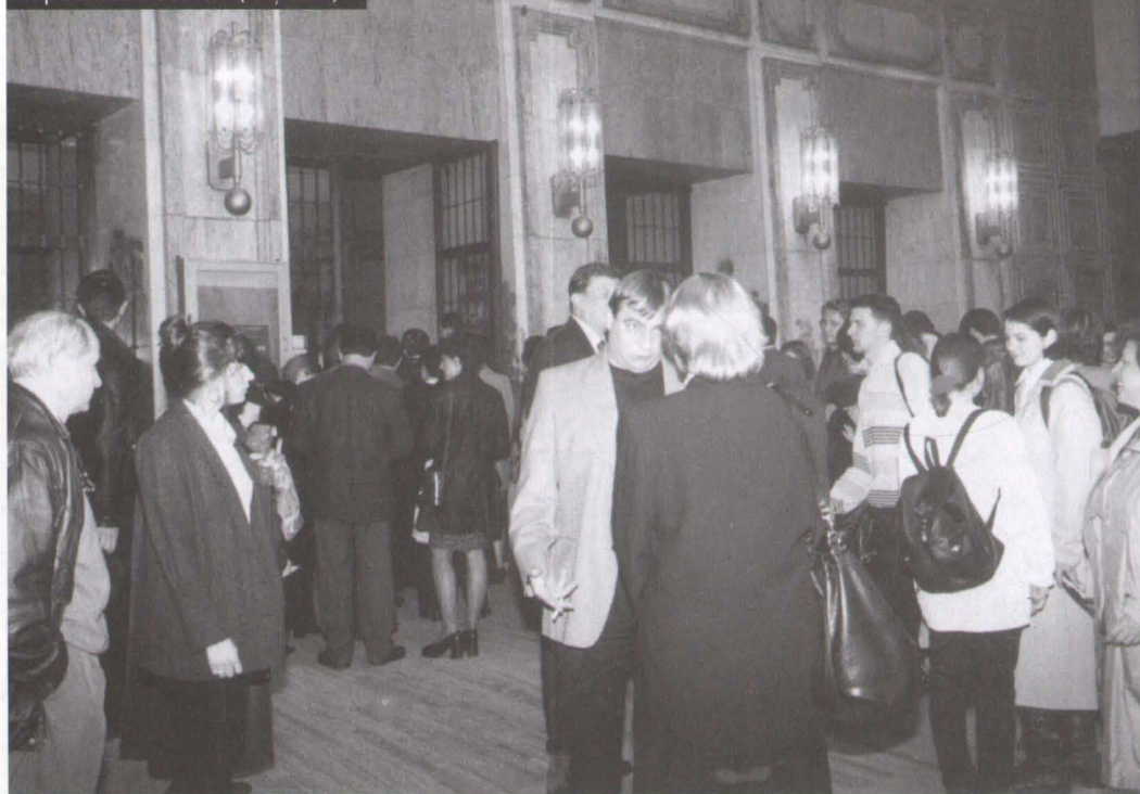
Alt public la alt teatru (Național)

când i-am dus pentru prima oară la teatru, la Omul din La Mancha . Poate că o exprima cu gândul la interesul material, deși nu cred; o făceau, categoric, pentru că simțeau că li se dă ceva ce nu li se mai dăduse niciodată până atunci. În Omul din La Mancha joacă unii colegi de-ai mei și aveam acces mai liber în Teatrul Național; copiii au văzut toată clădirea și au zis: „A cui e sala asta?” „Păi, a statului.” „Și de ce e așa de mare holul?” Eu cred că ești artist pentru că ai har și, dacă ai har, n-ai cum să nu fii generos, iar atunci nu-i poți anula pe ceilalți, chiar dacă sunt mai jos decât tine. Cred că experiența i-a schimbat pe copiii cu care am lucrat – nu pe toți, evident. Dar își doresc să mai joace, mă întrebă tot timpul: „Când jucăm?”. După un spectacol, l-au întrebat pe domnul profesor Todea: „Noi ce-o să facem de-acum încolo?”.