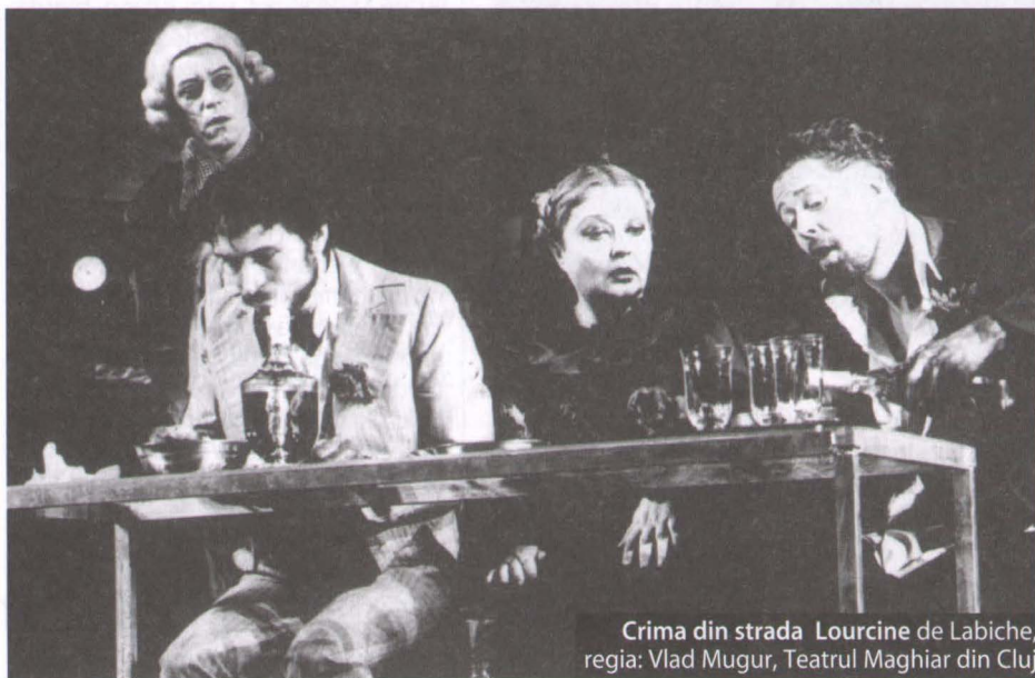
Crima din strada Lourcine de Labiche, regia: Vlad Mugur, Teatrul Maghiar din Cluj