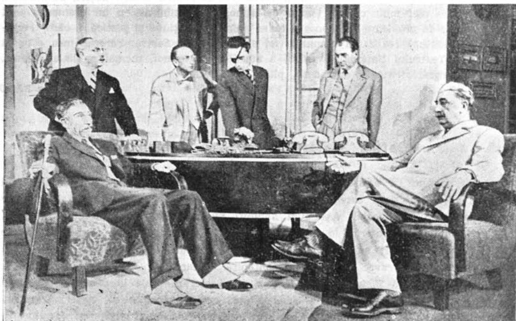
Scenă din tabloul 4

În totalitatea sa, spectacolul, pot spune, m-a satisfăcut. Aș vrea, totuși, să-i reproșez o anume atenuare a dinamicii personajelor. De aici, a decurs acea oboseală în ritmul spectacolului, care mi s-a părut contrară specificului volubil al temperamentului francez. Firește, mă refer la dinamica interioară a personajelor, la prompti-