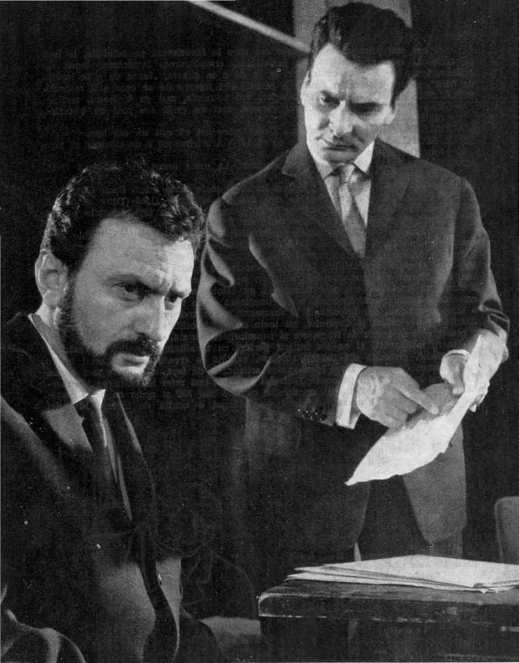
Amza Pellea (Horațiu) și Radu Beligan (Seful)