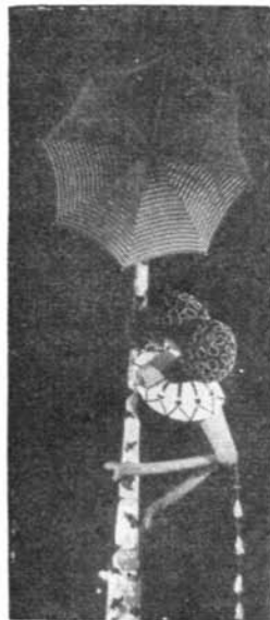
Pavianul în junglă

În sfîrșit, ritmul și tonalitatea generală a piesei vibrează de veselie, de poftă de joc — dispoziție absolut necesară pentru un spectacol de păpuși, pe care montarea lui Lenkisch o reali-