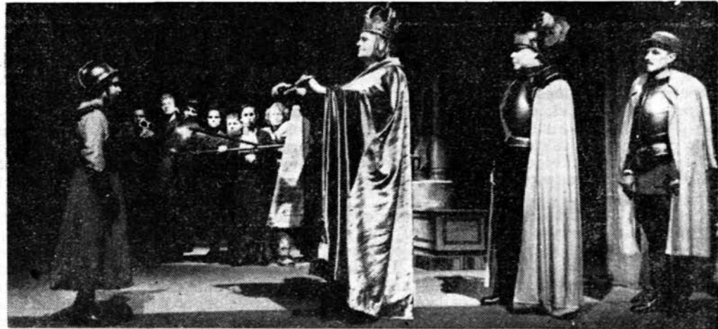
Scenă din „Viziunile Simonei Machard” de Bertolt Brecht, în regia lui Lothar Bellag

elaborat planuri și, în cele din urmă, guvernul a trecut la înfăptuirea acestei măsuri, care depășise faza intențiilor, impunându-se între timp ca o necesitate. Astfel, în legea pentru promovarea tineretului, din 8 februarie 1950, se puteau citi următoarele: „În cursul anului 1950 urmează să ia ființă în capitala Germaniei, Berlin, un teatru central pentru copii”, și la puțin timp după aceea, printr-o dispoziție a Ministerului Culturii din 22 martie se stabilea că: „Teatrul central pentru copii, care urmează a fi construit la Berlin, va trebui organizat și utilat în așa fel, încât să poată constitui un exemplu în acest domeniu pentru toată Republica Democrată Germană”.