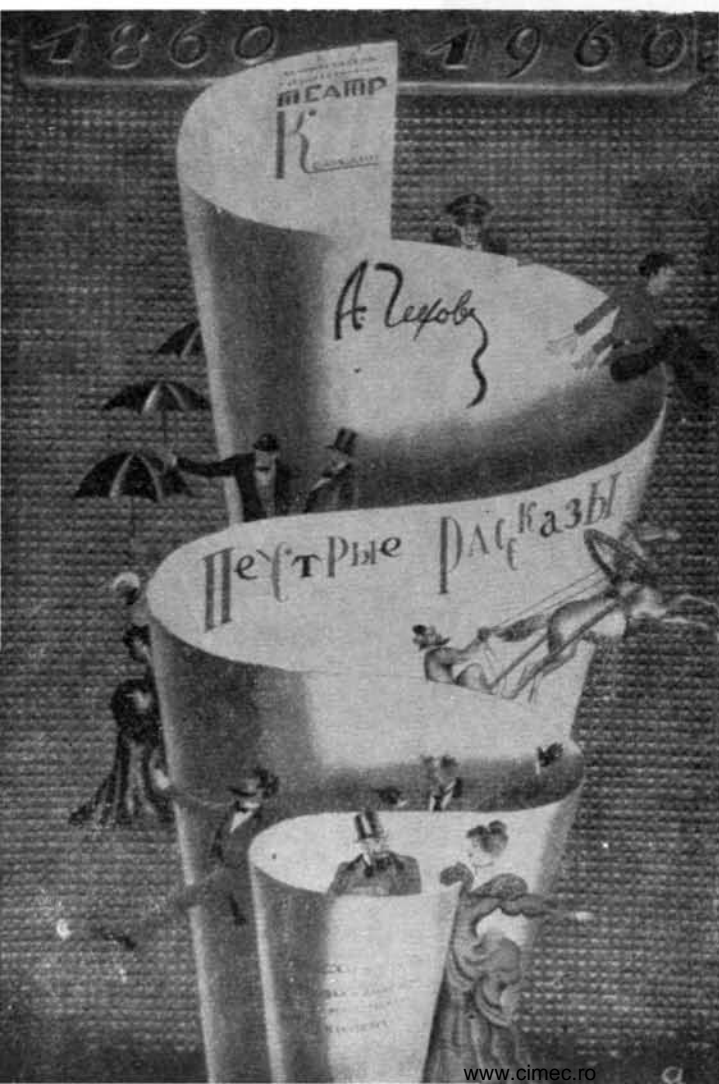
Afişul spectacolului jubiliar „Poveste peştrită” de Cehov, cu prilejul împlinirii a 100 de ani de la înfiinţarea teatrului (1860—1960)