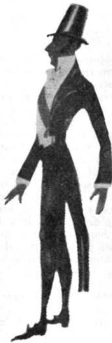
Schițe de costume pentru „Umbra” de E. Șvarț